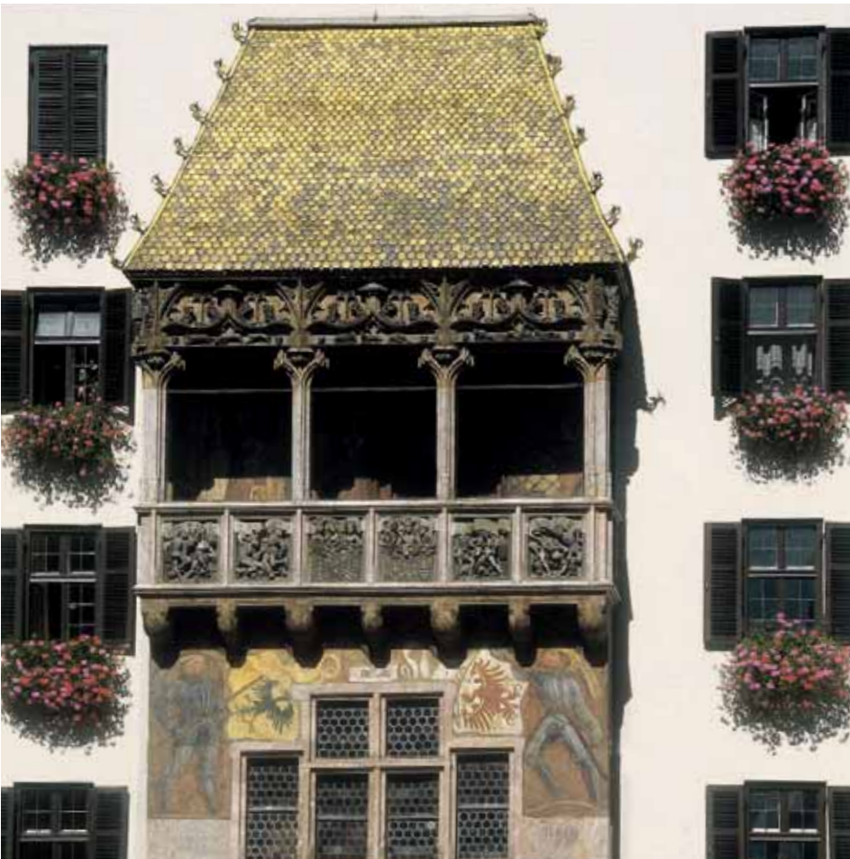
Das Restaurant „Goldenes Dachl“ ist eine Innsbrucker Gastronomie-Institution.

Nach dem klassischen Innsbrucker Wahrzeichen gefragt, antworten alle Einheimischen und Gäste unisono: „Das ist das Goldene Dachl“. Das stimmt nur zum Teil, denn Innsbruck ist seit April 2007 um eine Sehenswürdigkeit reicher, die mit dem Goldenen Dachl um die Wette strahlt: die neue Küche im „Restaurant Goldenes Dachl“ – natürlich von FHE FRANKE.