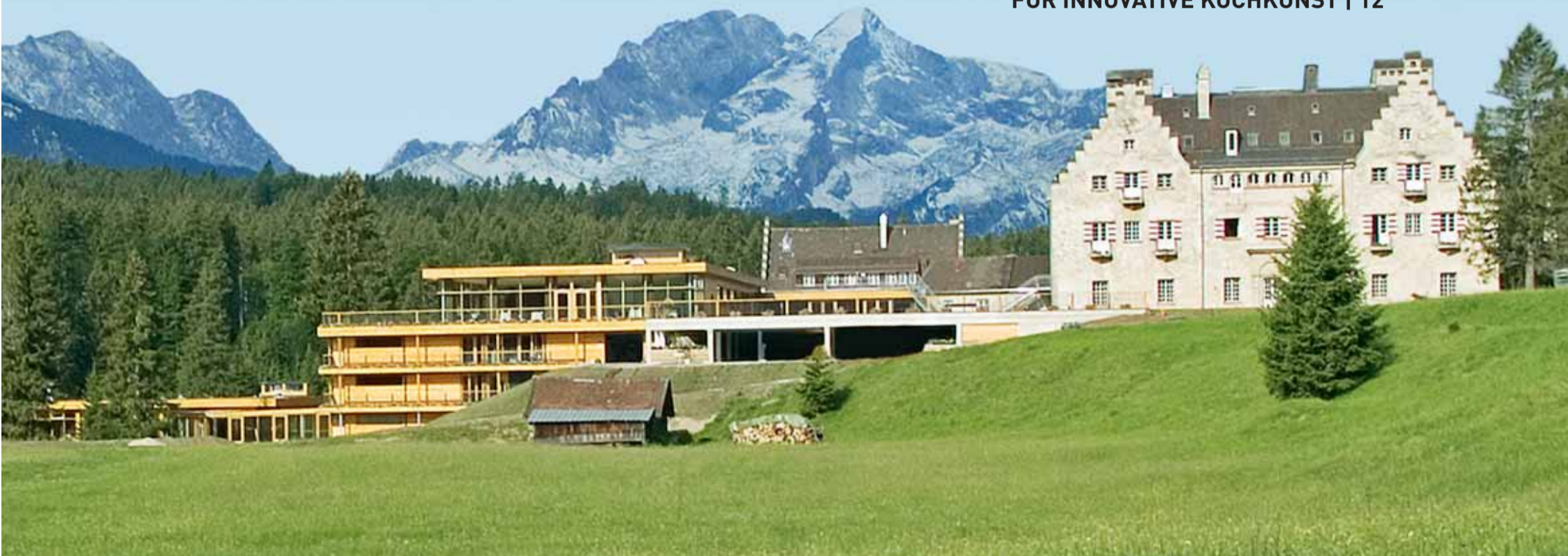
DER BISHER GRÖSSTE AUFTRAG: DAS HOTEL KORSTON | S 2

REVOLUTIONÄRE TECHNOLOGIE FÜR INNOVATIVE KOCHKUNST | 12