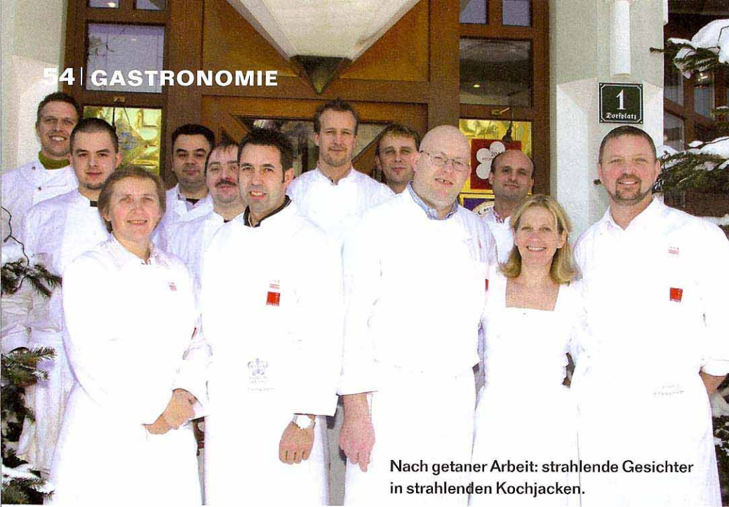
Nach getaner Arbeit: strahlende Gesichter in strahlenden Kochjacken.