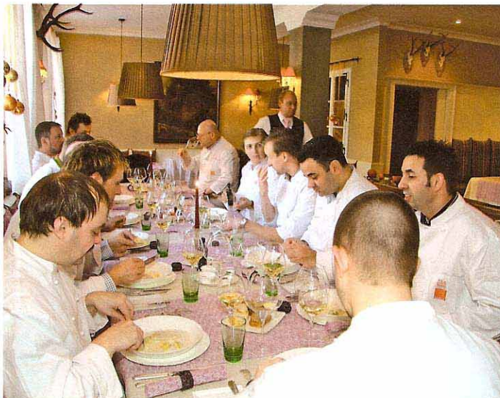
Gelöste Stimmung beim Abschluss-Essen.